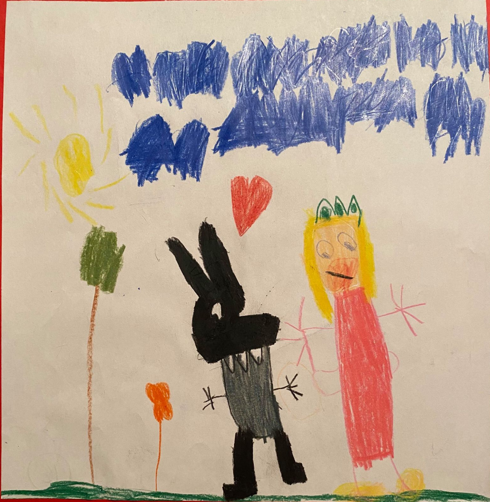
Un câlin à Loup.